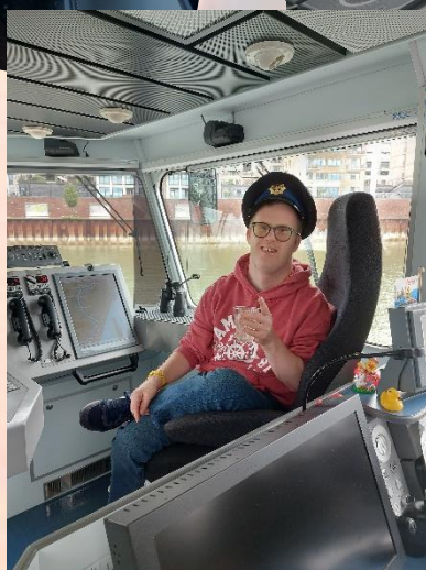
De jarige kapitein